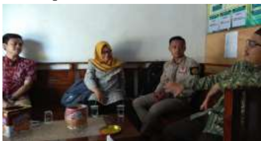
Gambar 1. Diskusi tim pengabdian dengan ketua yayasan Ponpes Subulus Salam