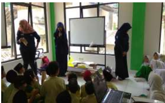
Gambar 4. Proses pemberian materi pada para santri

Grafik pada gambar 3 memperlihatkan bahwa jumlah santri yang siap (skor > 5) hanya 8 orang santri (16.3%). Namun, setelah mengikuti pelatihan semua santri yang mengikuti pelatihan siap dalam mitigasi bencana (100%).