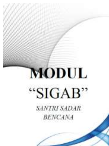
(Gambar 2. Cover buku modul Santri Siaga Bencana (SIGAB))