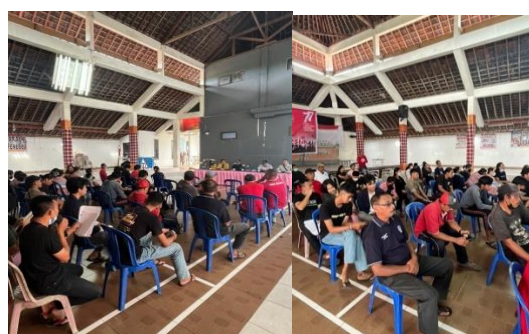
Gambar 2. Pelaksanaan Sosialisasi