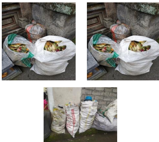
Gambar 3. Setelah pelaksanaan Sosialisasi