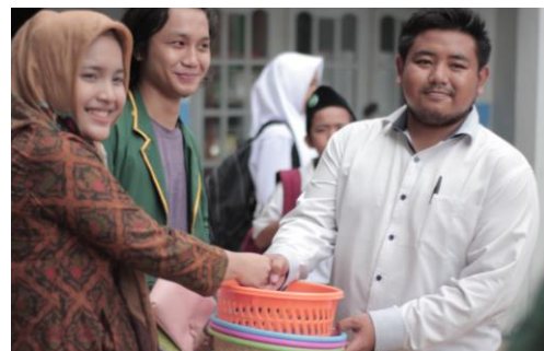
Gambar 2. menyediakan tempat sampah

Untuk mempermudah siswa membuang sampah kita memempatkan tempat sampah di tempat yang strategis. Misalnya di depan kelas, lorong sekolah, dekat tempat duduk di halaman, dekat kantin. Pilih tempat sampah yang kuat dan agak besar. Karena digunakan banyak orang jadi biar lebih terbiasa membuang sampah di tempat sampah.