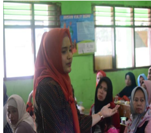
Gambar 1. Sedang memberikan pemaparan materi kepada guru pembuatan RPP berbasis lingkungan

Untuk menjalankan program peduli lingkungan, diberikan factor yang paling utama yaitu pembekalan guru untuk menjakankan lingkungan bebas sampah. Disini guru – guru diberikan palatihan tentang membuat RPP berbasis lingkungan. Sejalan dengan tugas guru yaitu membuat RPP (Rencana Pelaksanaan pembelajaran) sebagai pegangan seorang guru dalam mengajar di dalam kelas. RPP dibuat oleh guru untuk membantunya dalam mengajar agar sesuai dengan Standar Kompetensi dan Kompetensi Dasar pada hari tersebut. (Uno, 2015) Untuk itu saya memberikan pemaparan tentang pengembangan RPP berbasis lingkungan. Lingkungan yang tercemar oleh sampah dapat dimanfaatkan dengan bentuk mengemas RPP sebagai acuan pembelajaran di kelas. Berikut foto kegiatan pemateri.