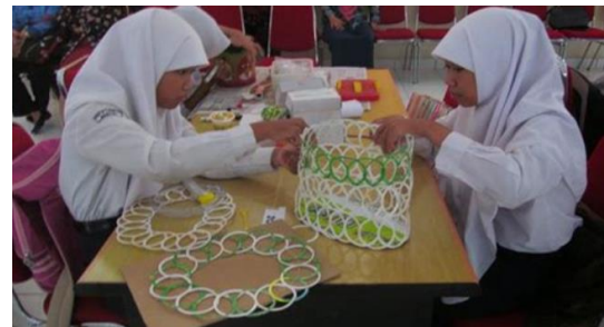
Gambar 3. Sedang mengadakan pameran dan lomba dari hasil sampah kerajinan yang dibuat oleh siswa

Setelah siswa tertib membuang sampah pada tempatnya, agar lebih berkesan adakan pameran hasil karya siswa dari sampah, namun tentunya harus ada pembinaan dan pendampingan tentang kegiatan tersebut, hasil karya bisa berupa tas dari plastik, tikar dari plasti atau baju dari plastik dan lain sebagainya